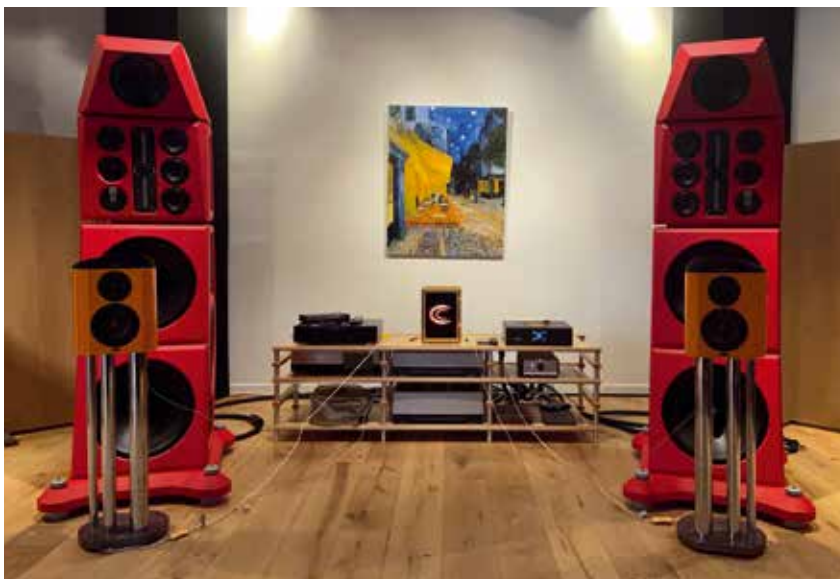
TWEE A-BRANDS BIJ ELKAAR IN ÉÉN LUISTERRUIMTE IN HET GELDERS ELST: DE REUSACHTIGE SILTECH SYMPHONIE EN DAARVOOR EEN SET CRYSTAL CABLE ARABESQUE MINISSIMO LUIDSPREKERS, VERBONDEN MET DE MONET SPEAKERKABELSET. DE ARABESQUES ZORGDEN IN DEZE OPSTELLING VOOR EEN AUDIOFIELE VERRASSING.

Tijdens het luisteren naar de Arabesques was ik eerlijk gezegd wel wat geïmponeerd door de set roodkleurige Siltech Symphonie luidsprekers, die in dezelfde ruimte stonden opgesteld. Groter dan manshoog en rond de € 380.000 per paar. Het riep bij mij het beeld op van een bezielend bedrijf, dat kiest voor de hoogste normen en waarden in de audioindustrie en met de missie van voortdurende, tijdrovende evolutie. Veel, heel veel research, uitproberen, testen. Alles zelf maken. En dan