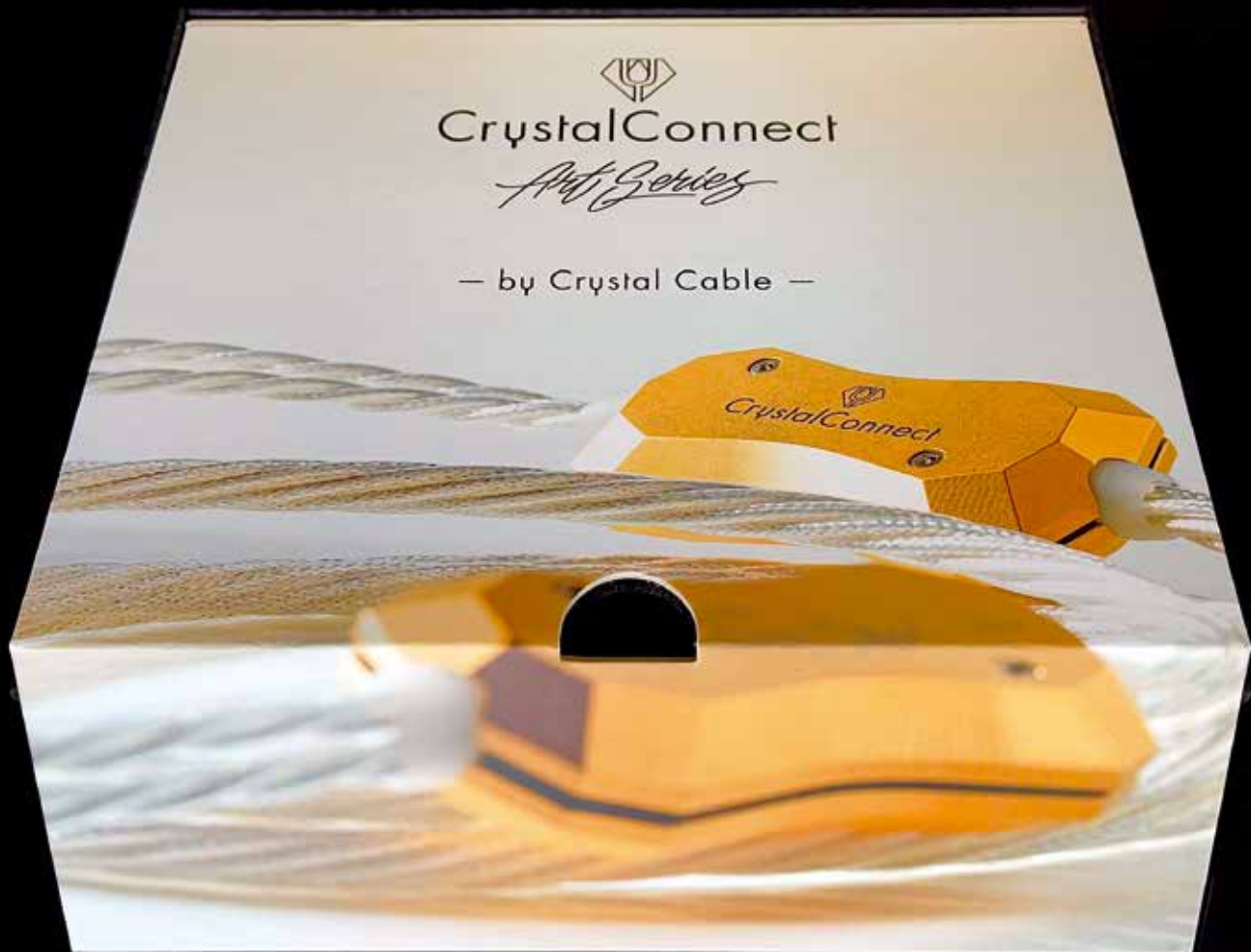
FOTO BOVEN EN LINKSONDER: ALLEEN DE HOOGWAARDIGE VERPAKKING VAN DE MONET, ZOWEL BUITEN-ALS BINNENKANT, VERRAADT AL DAT DE INHOUD IETS BIJZONDERS IS, NAMELIJK EEN SCHITTEREND AFGEWERKTE MONET INTERLINK UIT DE NIEUWE ART SERIES VAN CRYSTALCONNECT - BY CRYSTAL CABLE.