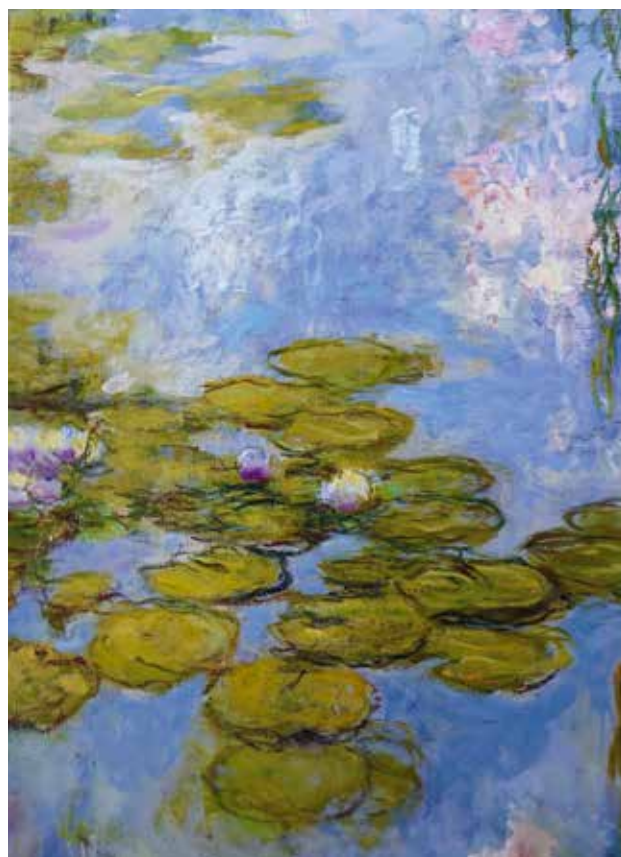
HET SCHILDERIJ 'NYMPHÉAS/WATERLELIES', DOOR CLAUDE MONET GESCHILDERD IN 1919, LAAT EEN ONGEKEND KLEURIG PALET ZIEN. FEITELIJK LAAT DE MONET RCA INTERLINK JE OP AUDIOGEBIED DEZELFDE ERVARING ONDERGAAN TIJDENS HET LUISTEREN. NEUTRAAL, KRISTALHELDER MET EEN SPRANKELEND PALET VAN BOVENTONEN.

Een label, met daarin een chip en antenne, en via NearField Communication Technology inleesbaar omtrent authenticiteit en eigendomscode. Over innovatie gesproken!